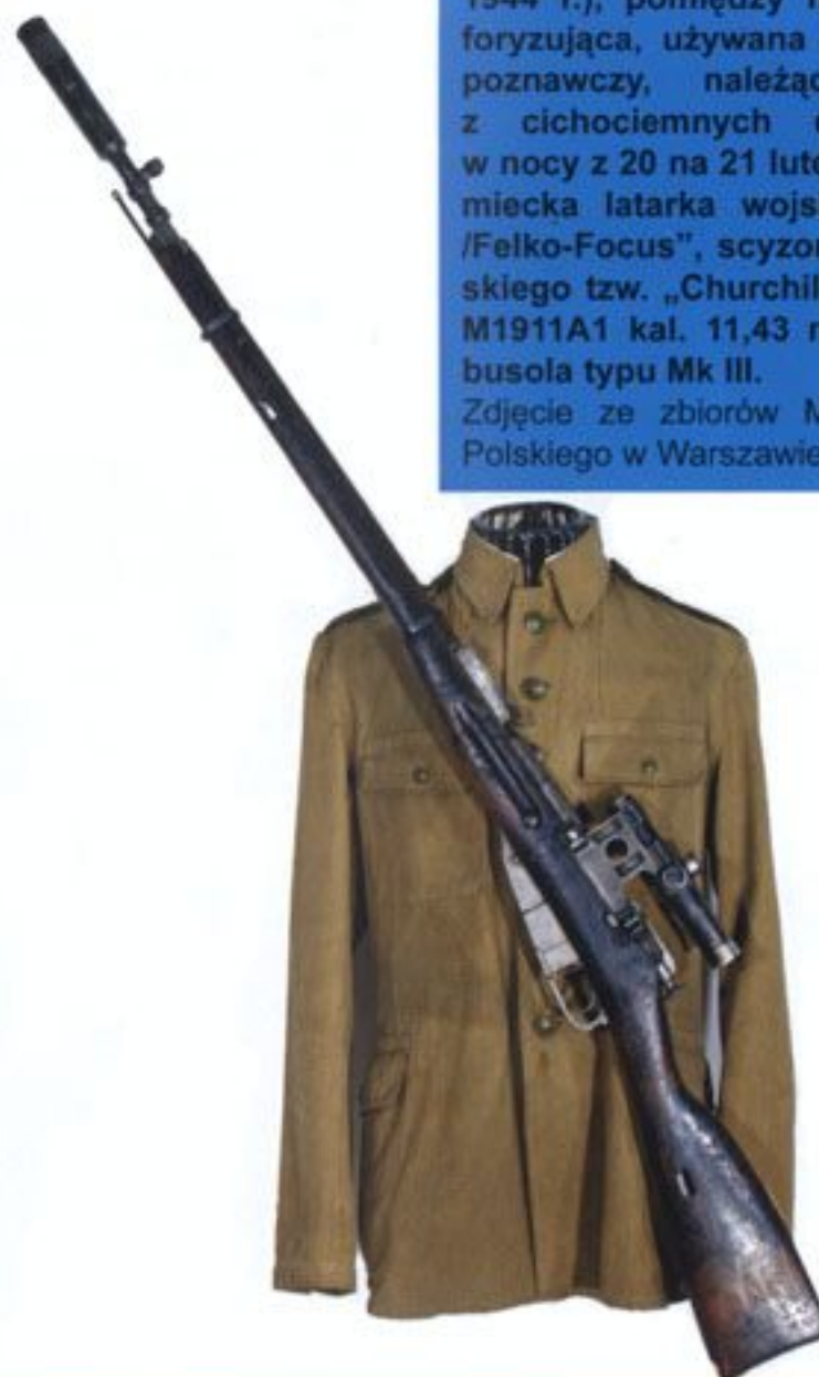
Kurtka mundurowa i karabin strzelca wyborowego Mosin wz. 1891/31 kal. 7,62 mm żołnierza Polskiego Samodzielnego Batalionu Specjalnego i grup dywersyjno-zwiadowczych działających na tyłach frontu wschodniego.