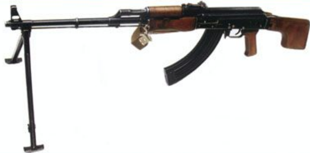
Ręczny karabin maszynowy RPKS kal. 7,62 mm, używany od lat 70. do końca XX w. przez żołnierzy wojsk powietrznodesantowych (później aeromobilnych) i jednostek specjalnych.