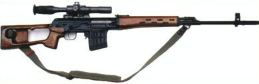
Karabin strzelca wyborowego SWD kal. 7,62 mm.