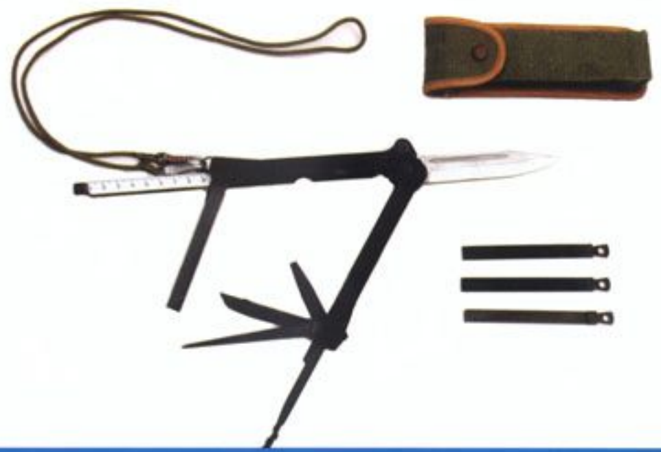
Wielofunkcyjny nóż wojskowy wz. 69 używany przez żołnierzy wojsk powietrznodesantowych i jednostek specjalnych Wojska Polskiego. Zdjęcie ze zbiorów Muzeum Wojska Polskiego w Warszawie.