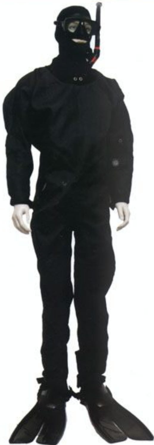
Kombinezon pletwonurka Grupy Specjalnej Pletwonurków „FORMOZY”, produkowany przez polską firmę Ocean Pro z Wrocławia, która ofiarowała do Muzeum Wojska Polskiego powyższy egzemplarz.