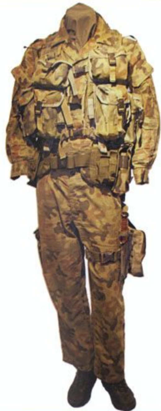
Mundur z kamizelką taktyczną KS (Kamizelka Specjalna) jednego z żołnierzy 1. Pułku Specjalnego Komandosów z Lublińca, uczestnika pierwszej i piątej zmiany Polskiego Kontyngentu Wojskowego w Iraku.