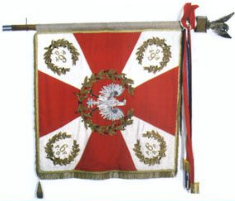
Sztandar 6. Pomorskiej Dywizji Piechoty, a od maja 1957 r. pierwszej w dziejach Wojska Polskiego dywizji powietrznodesantowej – 6. Pomorskiej Dywizji Powietrznodesantowej.