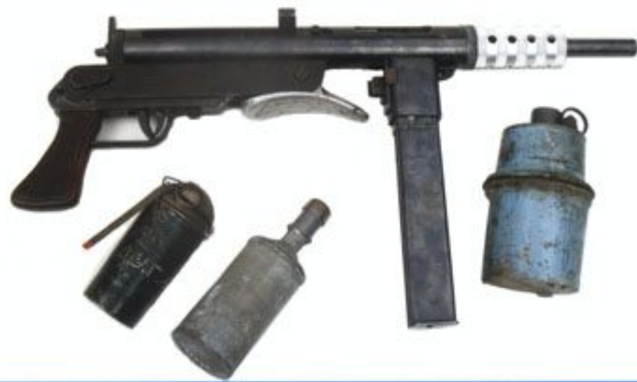
Przykładowe uzbrojenie żołnierzy oddziałów dywersyjnych Armii Krajowej – broń polskiej konspiracyjnej produkcji: pistolet maszynowy „Błyskawica” kal. 9 mm oraz granaty ręczne.