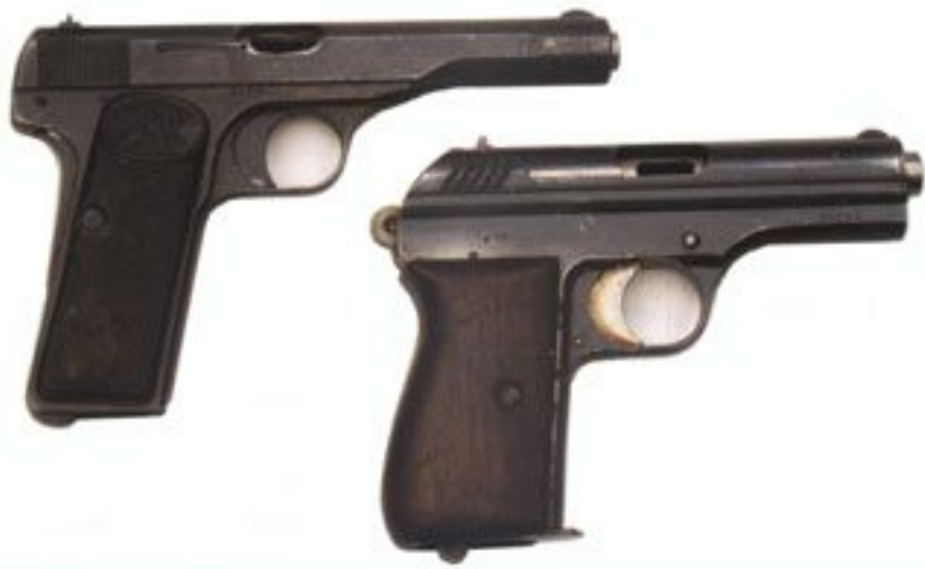
Przykładowe uzbrojenie polskich dywersantów używane podczas akcji „Łom”: pistolet Browning wz. 22 kal. 9 mm i CZ. wz. 1924 kal. 9 mm.